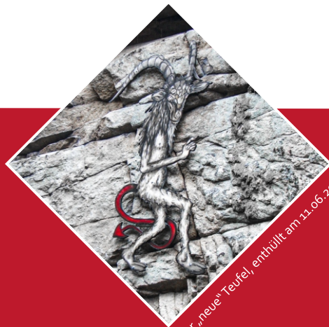
Der „neuer“ Teufel, enthüllt am 11.06.2011

Am Fuß der Südklippe ist im Gestein eine Gneisscholle erhalten. Zahlreiche Sagen und Legenden ranken sich um diese ungewöhnliche Felsformation. Auf der nebenstehenden Seite finden Sie eine davon abgedruckt: